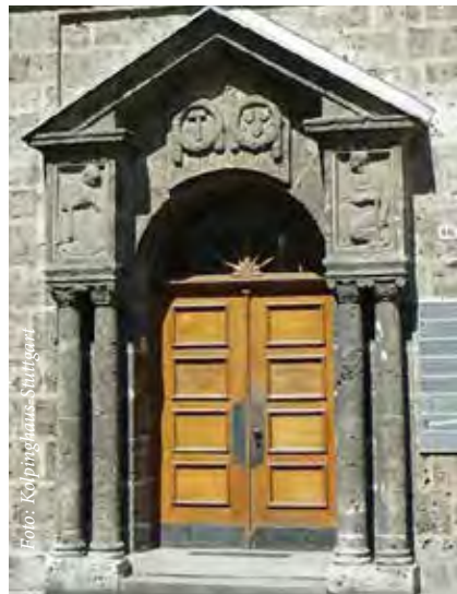
Eingang zum Kolpinghaus

Mit unseren katholischen und neuapostolischen Geschwistern feiern wir Gottesdienst. Da das Kolpinghaus auch über eine Küche mit regelmäßigem Mittagstisch verfügt, gibt es die Möglichkeit, anschließend Mittag zu essen. Eine Anmeldung hierfür ist nicht erforderlich.