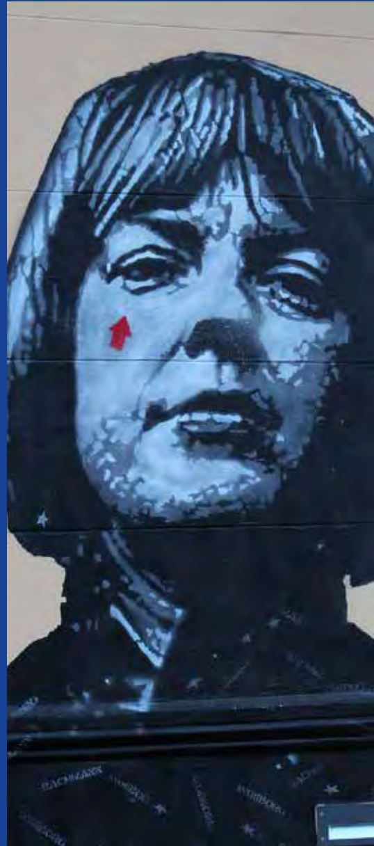
Graffito von Jef Aerosol am Musilhaus in Klagenfurt